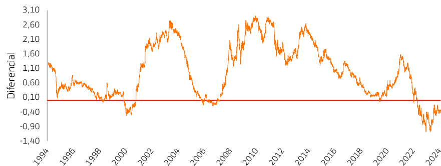
Spread bonos 2-10 años americanos

Bolsas: "Estabilización y rebote lento, si la geoestrategia da su permiso. Lo mejor: el ajuste de los bonos parece completado."